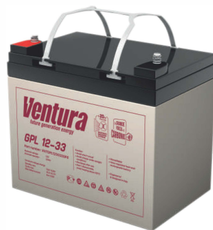
Габаритные размеры, мм

Примечание: приведены средние значения, полученные в течение трех циклов заряда/разряда Производитель оставляет за собой право вносить изменения в связи с проводящимися мероприятиями по оптимизации типов